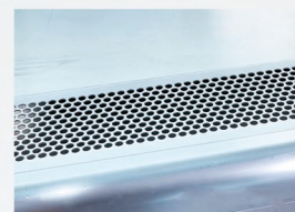
负压过滤网 防止碎屑异物进入 设备内部