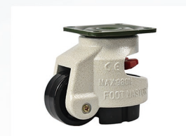
福马脚轮 万向移动 可调水平