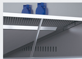
工作台面支架 集液槽清洗方便