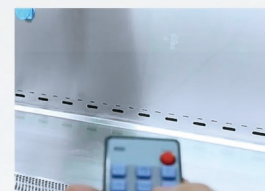
智能遥控 所有功能遥控操作 预约定时