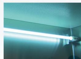
紫外灯 产生 254nm 的紫外线 有效杀菌