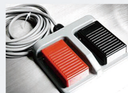
脚踏开关 脚踏一键升降 解放双手